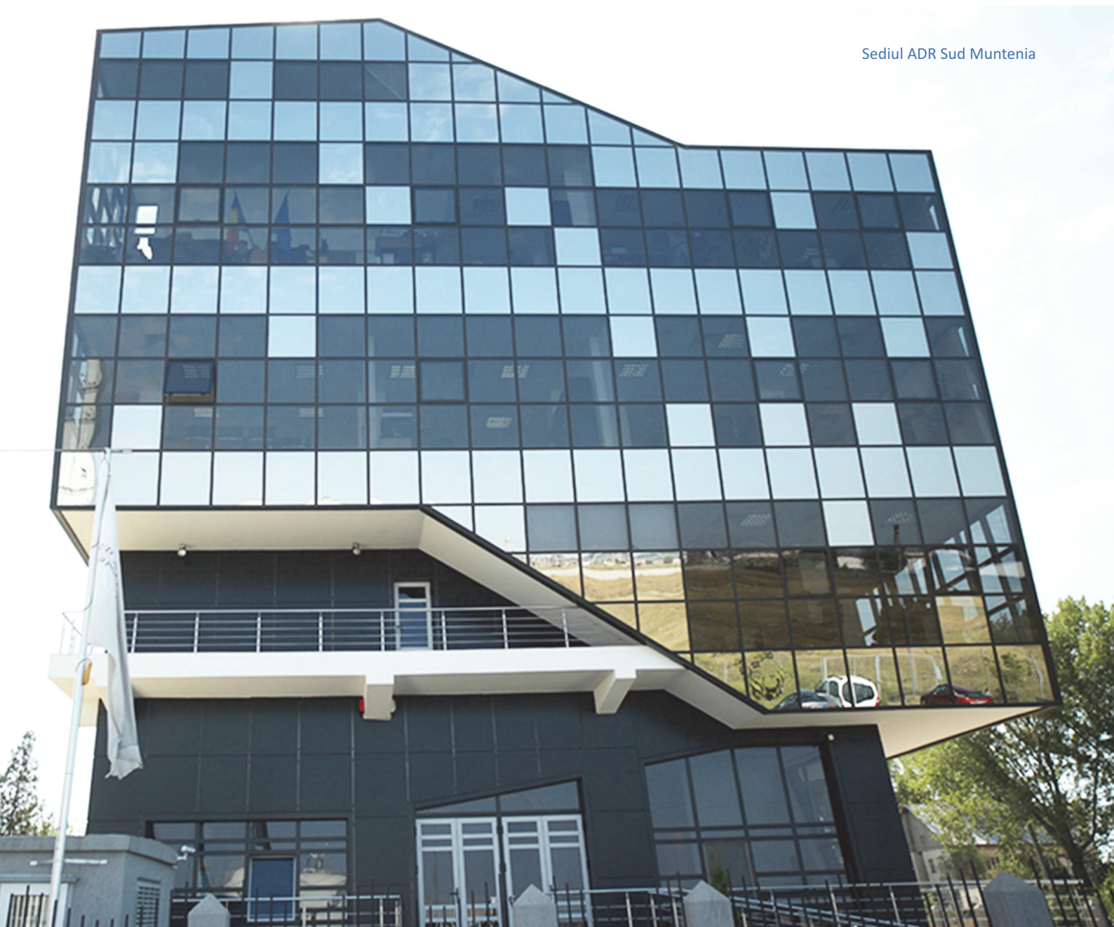
Sediul ADR Sud Muntenia