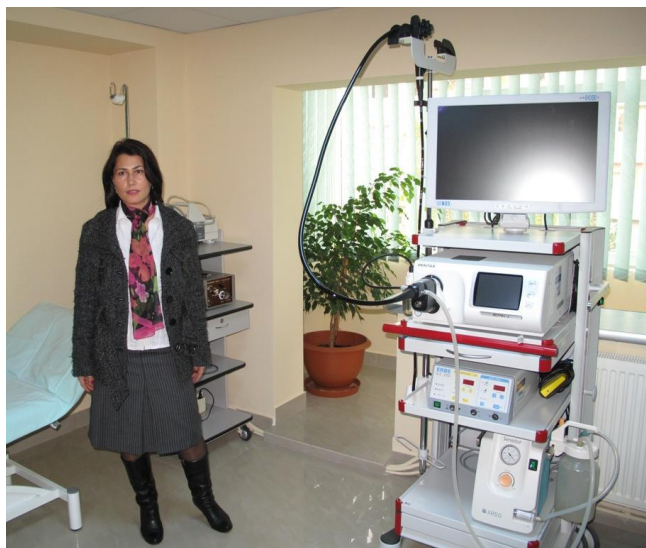
Fotoarhivă: Beneficiar fonduri Regio (SC Tehno Doctor Endoscopy SRL)

Până în momentul de față au fost semnate 247 de contracte de finanțare , din care șase au fost reziliate, 64 de proiecte se află în etapa de contractare, din care cinci în rezervă, iar 52 au fost admise pentru etapa de evaluare tehnică și financiară și se află pe lista de rezervă, cu o valoare totală a asistenței financiare nerambursabile de aproximativ 61,22 milioane de euro .