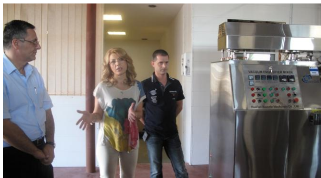
Fotoarhivă: Beneficiari fonduri Regio (SC Toyland International SRL)

Până în data de 29 iunie a.c., la sediul Agenției pentru Dezvoltare Regională Sud Muntenia au fost depuse 888 de proiecte , prin care se solicită finanțare nerambursabilă prin Regio (Programul Operațional Regional), Pla-