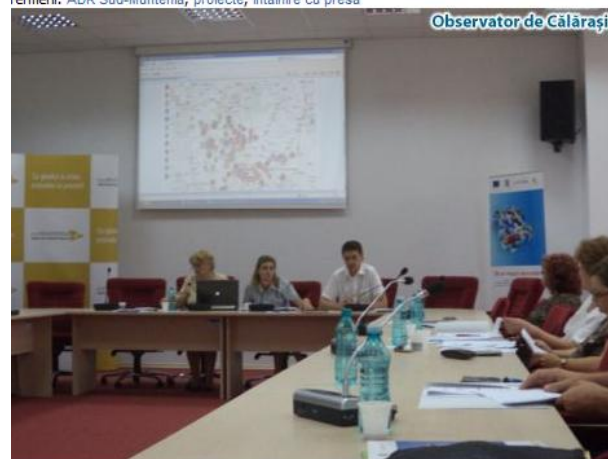
Observator de Călărași

Termeni: ADR Sud-Muntenia, proiecte, întâlnire cu presa