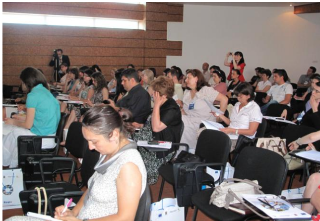
Fotoarhivă: Forumul Comunicatorilor Regio - 22 - 24 iunie 2011, Neptun

Acest eveniment va fi organizat, la Voroneț, județul Suceava, de Autoritatea de Management pentru Programul Operațional Regional din cadrul Ministerului Dezvoltării Regionale și Turismului.