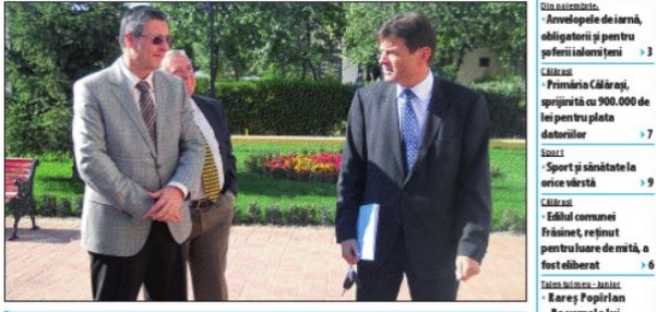
Reprezentanții Agenției pentru Dezvoltare Regională (ADR) Sud Muntenia au vizitat câteva obiective finalizate sau în curs de implementare din județ. În compania doi reprezentanți europeni.