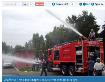
CĂLĂRAȘI | Una dintre mașinile pe care o vor primi cei de la ISU

1 septembrie 2011, 19:21 | Autor: Daniela Drăghici | 340 afișări Cuvinte cheie: Călărași, ISU, mașini, îmbunătățiri.