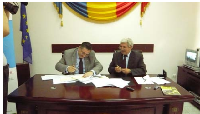
Fotoarhivă - Semnare contract de finanțare Regio

Autoritatea de Management pentru Programul Operațional Regional din cadrul Ministerului Dezvoltării Regionale și Turismului a emis Instrucțiunea privind suspendarea depunerii de cereri de finanțare în cadrul Domeniului major de intervenție 3.2 „Reabilitarea/modernizarea/dezvoltarea și echiparea infrastructurii serviciilor sociale”, din regiunea Sud Muntenia.