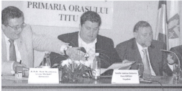
Semnarea contractului de finanțare

În data de 21 august 2009 s-au deschis ofertele în cadrul licitației pentru reabilitarea Drumului Sudului, care leagă localitatea Dobra de Cornățelu, de Braniștea, de Titu, Odobești până la Corbii Mari. Acest drum este foarte important pentru județul Dâmbovița, pentru